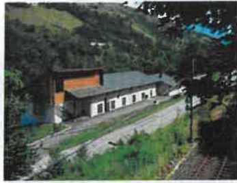
Syndicat d'assainissement des Granges